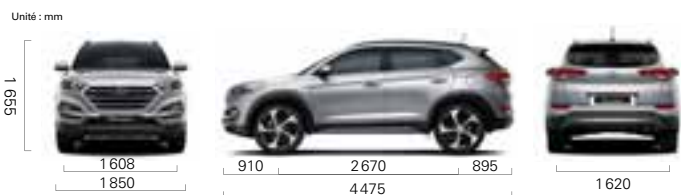
Version 1.7L 4x2 BVM