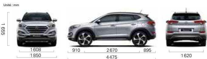
Version 1.7L 4x2 BVM